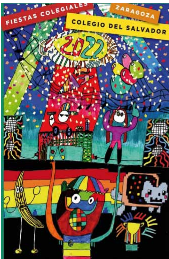
Autor: Eduardo Castro